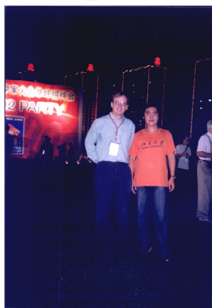
davibaby 在 ICM2002