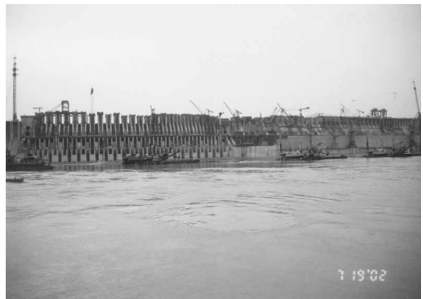
从长江上看三峡大坝

Ps：你们要是所有人一齐来敲我报告的话，大概每人一支小布丁就是最高待遇了，嘿嘿。