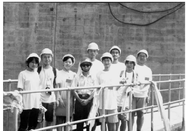
谁的安全帽戴法是正确的？

参观中华鲟园和葛洲坝。鲟园内的各种各样的鲟鱼让人目不暇接，其实恐龙的兄弟也挺可爱的，不仅在于它的全身是宝。我发觉我真的是一只鱼，而且应该是鲟鱼，绝对没错，真的，不信你看我的照片。其中最大的两条均在2m-4m，体重1吨左右（不就是20个我嘛），年龄大概在60岁。其实扬子鳄不发飙的样了也挺可爱的，居然敢像我一样张着嘴巴睡觉。葛洲坝就一