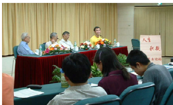
人生积微 院士论坛