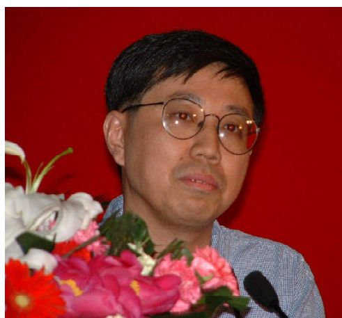
田刚院士在开幕式上发言