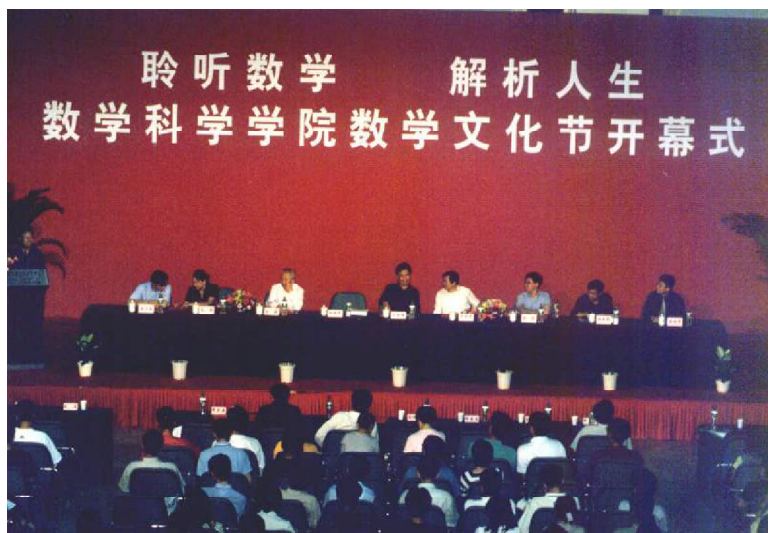
数学文化节开幕式