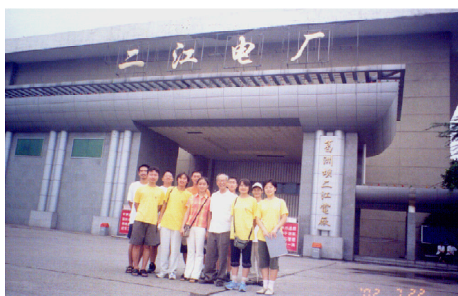
学生会实践部组织的暑期赴三峡实践团