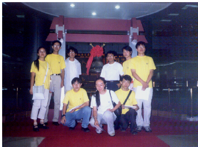
学生会实践部组织的暑期赴深圳实践团