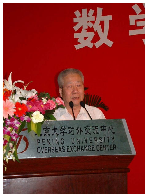
林群院士在开幕式上发言