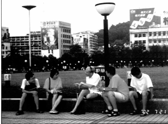
和传说中的老外对话

葛高的学生们讲我们如何如何策划如何如何联系的时候，她脸上激动的神情让我能猜出她在其中的付出，然而正如她所说的，到了最后，所有的苦和累也都无所谓了。